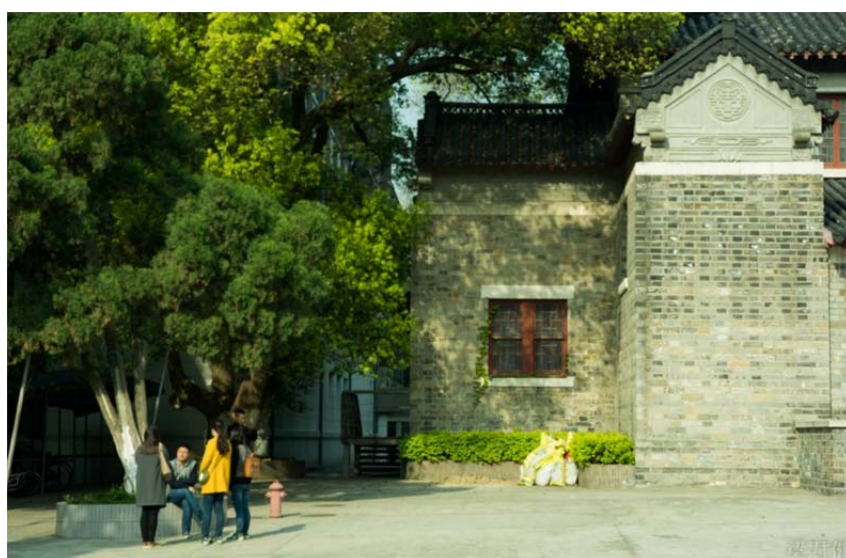
（图：南大校园里的一棵古树下，师生切磋琢磨）

我自己这个学期承担的教学任务比较多，每周要讲十五个学时。虽然论坛是周末的两天，但是前头的周五和后头的周一都有课，无奈之下只能开启“HARD”模式，周五早晨收拾好简单的行囊，带着上课，一下课就地铁去火车站；周日晚上从扬州坐一夜火车，周一上午下了火车直接赶到教室继续上课。然而，行程越是匆忙，内心愈加珍惜。