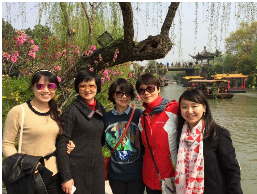
(二十四桥，我们来啦！出自邹军)

多友中的多数是如我一样正值中年，日常生活中有太多负累。江南三月，草长莺飞，杂花生树，瘦西湖上的泛舟冶春尽管只是短短一瞬，却是人生难得际遇。周作人说：同二三人同饮，得半日之闲，可抵十年尘梦。多友何止二三好友，所得何止一茶一饮！春和景明、志趣相投、学术砥砺、诗文酬和，一个小小的学术社群，能够情谊如此金固，旨趣如此相投，正如 CC 所说，这是因缘际会！