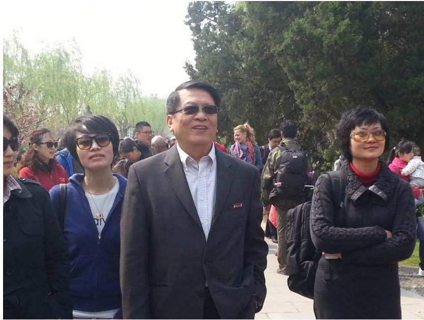
(请注意 CC 胸口上的“南京大学”校徽，出自邹军)