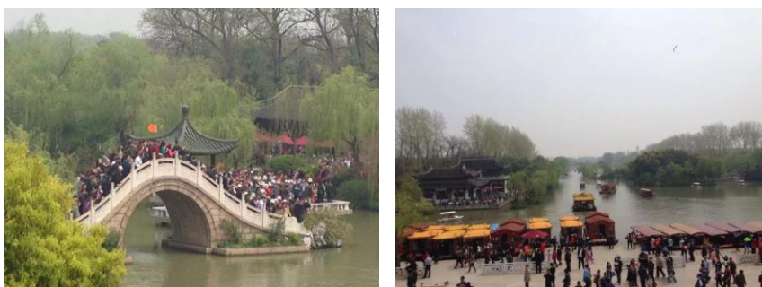
瘦西湖的美景让首届多闻论坛增色

乎产生了一种幻像，感觉多友们也有一块地中海。这个地中海可能是香港的维多利亚海湾，也可能是扬州的瘦西湖；或者它没有一个具体的地点，它只存在于每个多友的心中，是一块无形的学术地中海。每年多友相聚，散落在两岸三地乃至世界各地的华人学者，可以将不同的地域文化、独到的学术见解、丰富的游学见闻带到“地中海”；如果假以时日，多友地中海将会孕育出更多的学术成果。