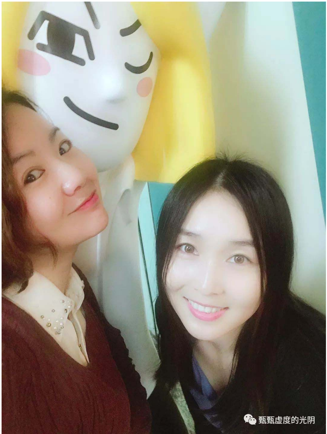
(图名：黑与白。那是我俩第一次逛街，很嗨皮！ )