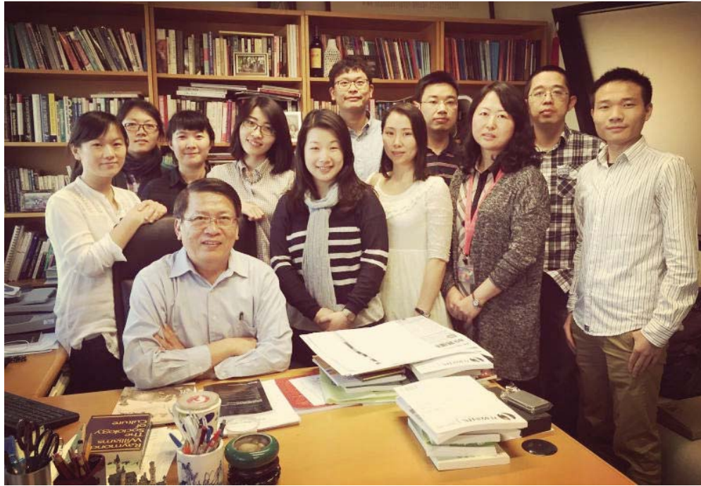
2015,4,15 : 永不褪色的记忆

何舟老师给我们讲的是香港的言论自由与媒体发展，对我们深入了解一方水土大有裨益。他果然无愧为凤凰“名嘴”，言辞犀利，口若悬河，目光敏锐，气场极大。何老师还分享了他在纪录片拍摄过程中的种种奇遇，令我们心驰神往。