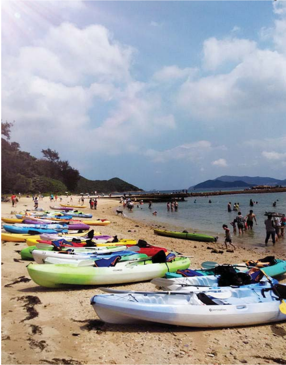
2015,5,3: 西贡, 上帝的调色板

周末时光常与师友们一起去行山远足，香港如画的山水深深打动了我。如果能用画风来比喻的话，《从太平山望维港》是现实主义，《西贡桥咀岛的海滩》是浪漫主义，《南丫岛小渔村》是现实主义，《浅水湾的斜阳》是印象主义，《贝澳的白鹭》则是一幅传统中国文人画……一座600万人口居住的拥挤城市，竟能将环境保护得这样好，足见港人对这片天地的珍视。