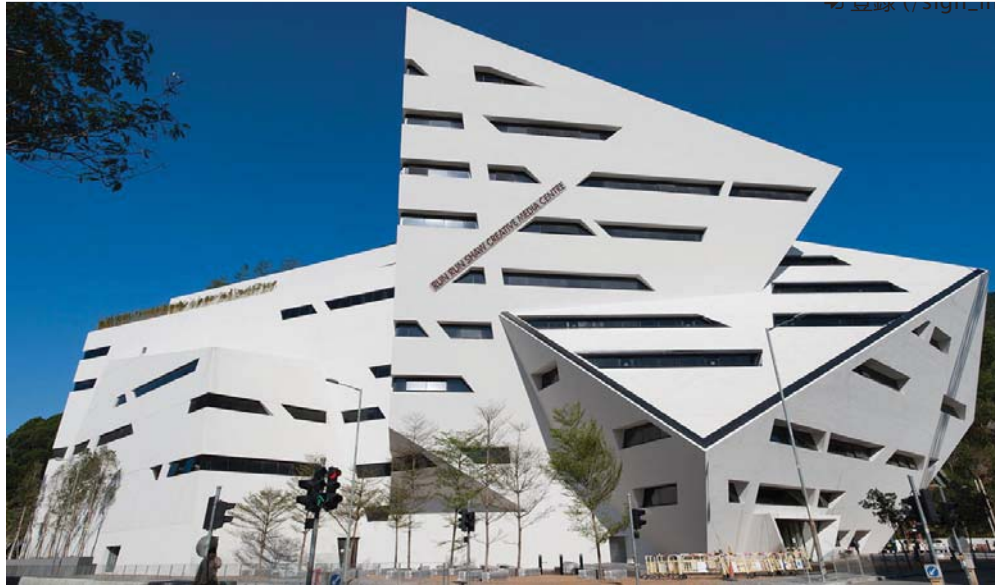
2015,4,8：“造梦空间”惊鸿一瞥

我为学术而来，收获却远不止于学术。每周日程表上满满当当，硕博课程、分享会、交流会、讲座及媒体考察等不一而足。所见的老师远不限于所列名单，同时老师们的分享交流往往延伸到课堂之外。更重要的是，我在此间亲身感受了媒体与传播领域顶尖华人学术团队的品格、风范与人性光辉——