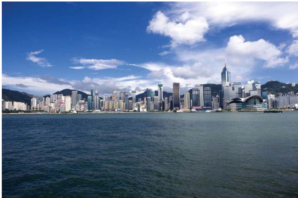
一座海港，看尽百年沧桑