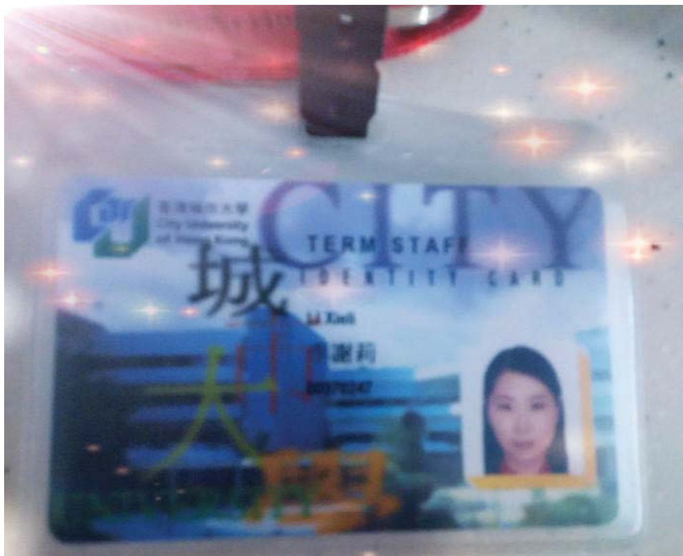
2015,5,7：舍不得归还职员卡