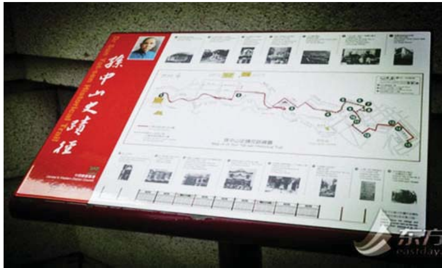
2015,4,26 : 擦拭历史的尘埃

仁书院旧址、香港西医书院旧址、道济会堂旧址、香港兴中会总会旧址、中国日报报馆旧址……那些风起云涌腥风血雨的历史场景瞬间鲜活于眼前。走过这段路，你才真正明白百余年前香港如何成为中国革命与中国革命报刊的策源地。