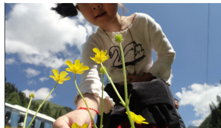
（左图：谁能想象，这片世外桃源的外面是怎样的风景？