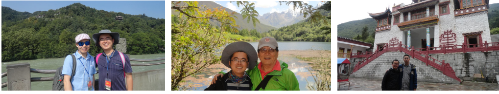
（左中右：分别与顺铭、CC、海龙合影）