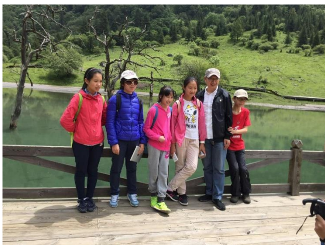
(Duowen babies 多二代)

两周前先红经年努力见证日——新闻史学会公共关系史研究委员会成立时， 许多多友前去捧场。 我刚到会场， 何舟老师晃悠过来握手， 他说“我跟黄煜就隔一条街， 三年来今天才见到。 咱们离那么远， 隔月见一回。” 是啊， 因为多闻雅集， 因为多友情谊， 远远近近、时长时短， 总能见到，常常见到！