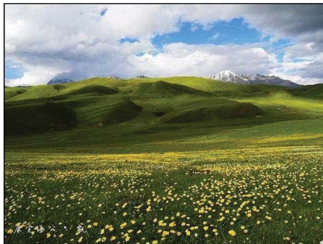
开满野花的草原，我想为你歌唱

多少次我透过车窗，放眼窗外的蓝天白云、巍巍青山、皑皑雪峰、无际的草原、蜿蜒的河流、肥壮的牛羊，还有在山间、在草原、在水边摇曳的五彩经幡，心中都升腾起一种“山河壮美”的万丈豪情。多少次我好想化做天上的雄鹰，于万里长空御风翱翔；好想化身藏族牧民，一骑骏马，在野花烂漫的草原上扬鞭驰骋；多少次我都多想在这高原云天中亮开嗓子痛痛快快地放歌一场！