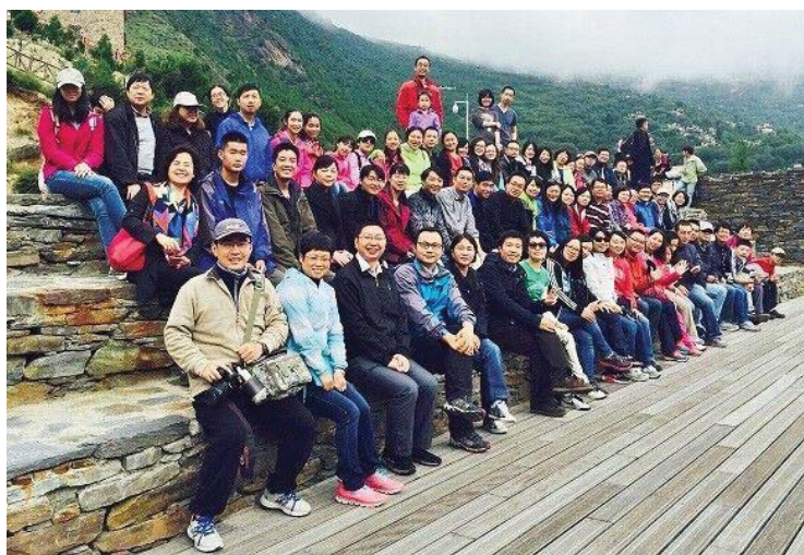
今年的全家福，明年还约吗？