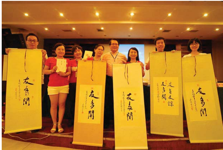
独一无二，珍藏一生