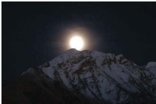
在那东山顶上，升起皎洁的月亮

我无意地向窗外望去，远离了人间灯火的小镇显得无比沉静、悠远和深邃，朦胧得望不到尽头，但偶然一抬头，如黛的远山之上、湛蓝的夜空之中，一轮皎洁的圆月竟与我的目光撞个满怀！霎那间，仓央嘉措的诗作“心头影事幻重重，化作佳人绝代容，恰似东山山上月，轻轻走出最高峰”浪涌心头、萦绕在耳边。