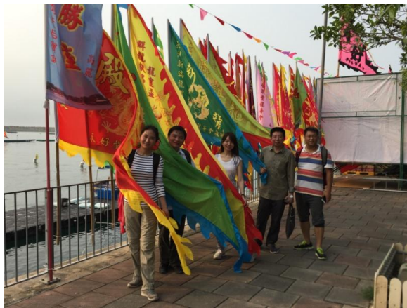
图表 2 在长洲岛

我们二期小分队还自己组织过游长洲岛，这也是唯一的一次人数众多的离岛之行。那天我们乘风破浪到了长洲，看到集市熙熙攘攘，与海面的安宁相映成趣。那天实在是阳光灿烂，但钻进张保仔洞时，却没有一丝光线，伸手不见五指。独自一人待在洞中，真的会一日千年。出洞后看了看前面的张杰，松了口气，瞬间有生死之交的感觉。沿海徒步时，我们还集体看到了一条会“飞”的鱼，它在波光粼粼的海面上轻盈地“舞蹈”，我们在欢笑。只是这一幕，就值这一程。