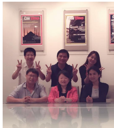
图表 12 临行前夜，到教室留念