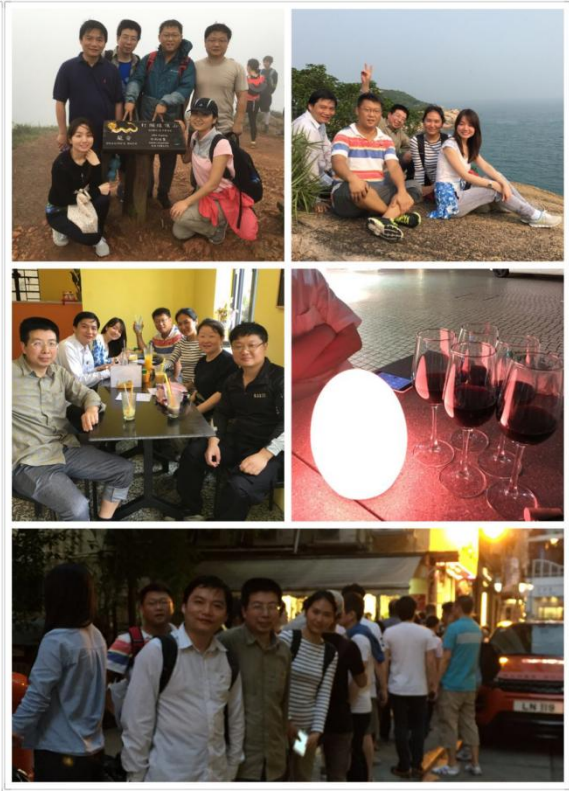
图表 7 在香港的风景里