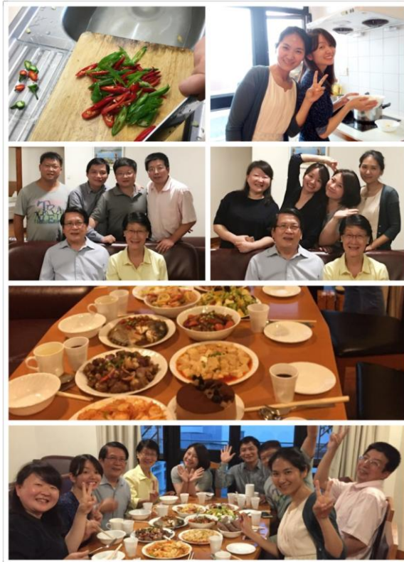
图表 6 在小八豪宅聚餐