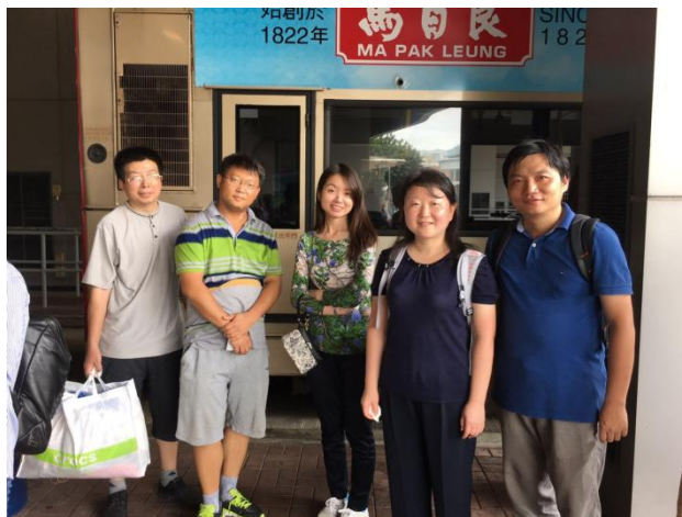
图表 8 豪华亲友团相送

拉拉杂杂这么多，还是有许多未尽之处。反观自己带去的各项计划，其实并未完成，但计划之外的收获，会让我受益终生。衷心地感谢李老师和城大诸位老师的真诚礼遇，你们的治学精神和待人之道，已经成为标杆，给了我坚定的力量。回到上海的日常，虽然不能便捷地使用 google，却感受到四月间发生在诸多空间中的事件都相互勾连在一起（波及全球的巴拿马事件、香港的明报事件、北京的中青院改制风波等）。对这些事件的解读，掺杂了我的香港经验，让我有了新的视角。