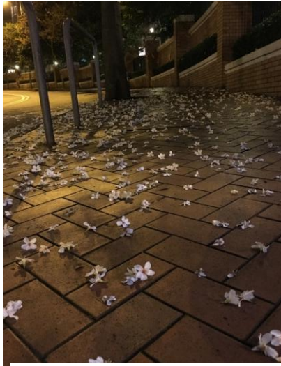
图表 9 海棠路

这个多雨的香港四月，只是诸多四中的一个。但它就像小王子那朵独一无二的玫瑰花，我付出了爱，它把多雨作多情，也爱上了我，成为我生命中一个闪亮的瞬间。