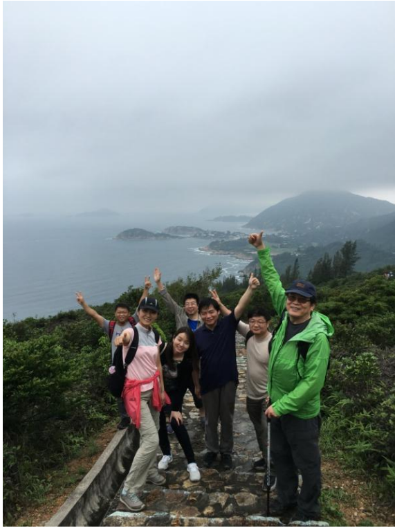
图表 1 以上 4 图为 在龙脊与石澳

我们二期小分队还自己组织过游长洲岛，这也是唯一的一次人数众多的离岛之行。那天我们乘风破浪到了长洲，看到集市熙熙攘攘，与海面的安宁相映成趣。那天实在是阳光灿烂，但钻进张保仔洞时，却没有一丝光线，伸手不见五指。独自一人待在洞中，真的会一日千年。出洞后看了看前面的张杰，松了口气，瞬间有生死之交的感觉。沿海徒步时，我们还集体看到了一条会“飞”的鱼，它在波光粼粼的海面上轻盈地“舞蹈”，我们在欢笑。只是这一幕，就值这一程。