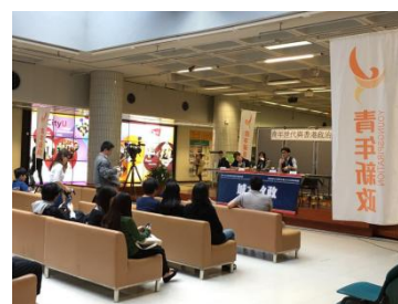
图表 5 AC1 公共走廊中的一段