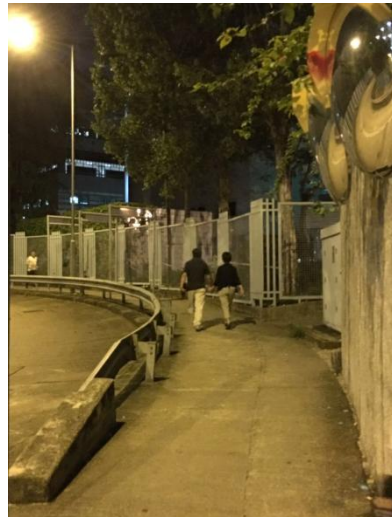
图表 10 幸福的背影