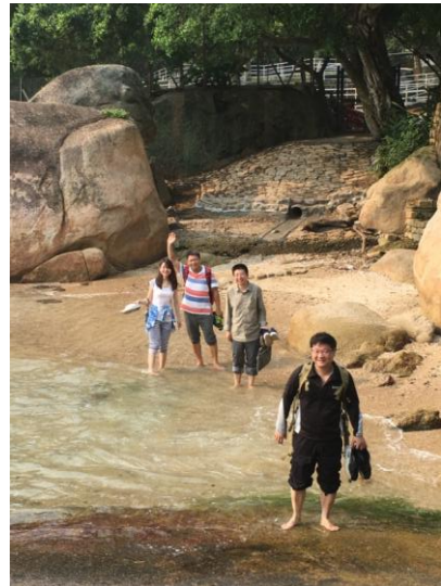
图表 3 在长洲岛