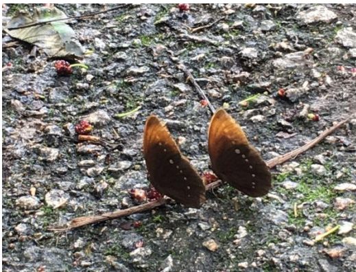
图表 11 龙脊 排队的蝴蝶