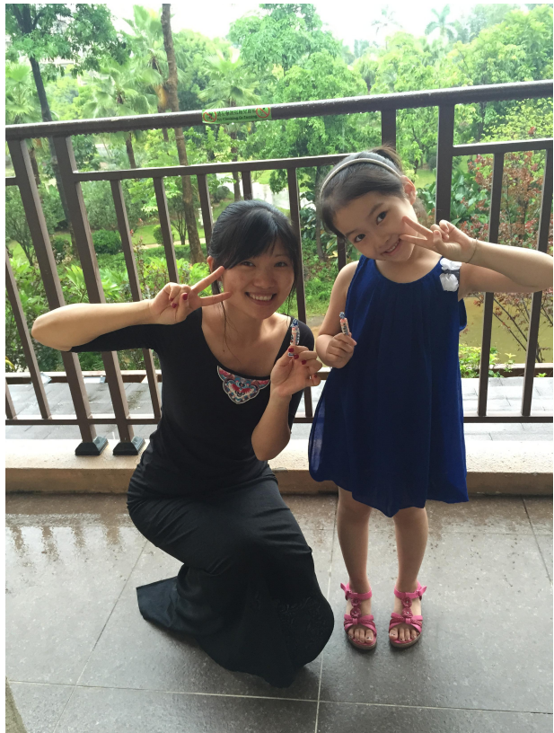
卖萌，学朵朵摆 POSE，手里举着她送我的大白兔奶糖。