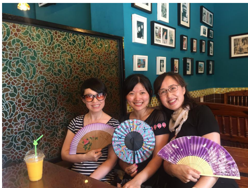
在岭南印象园，买了两把扇子送给姐姐。