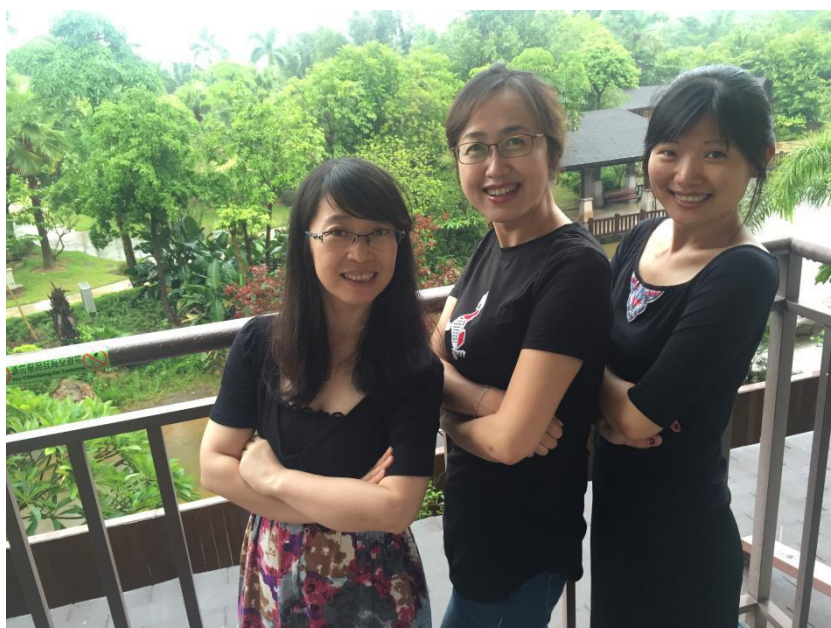
返程广州前，匆匆喝茶小聚。

本届多友会终于圆满结束了，对各位亲爱的多友、多友之友、多二代，我想说：这一程，风雨交加，感谢你们能来，感恩你们一直都在，明年夏天，我们北京再见！