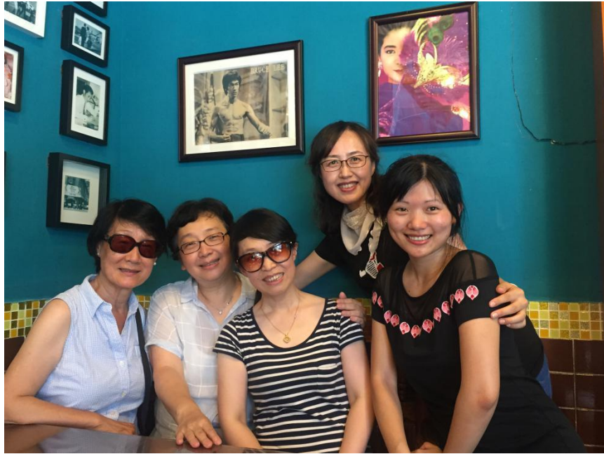
师母、李导夫人和我们三姐妹。摄于岭南印象园南风窗咖啡馆。