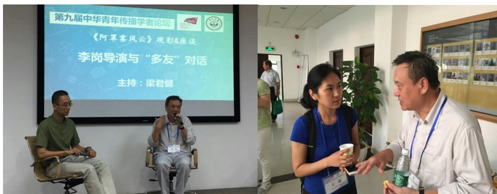
李岗导演与“多友”对话：《阿罩雾风云》观影&座谈