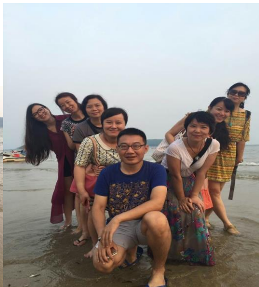
下川岛的美丽海景与海边的“那些花儿”：“小妖、小仙、小白、小明……”