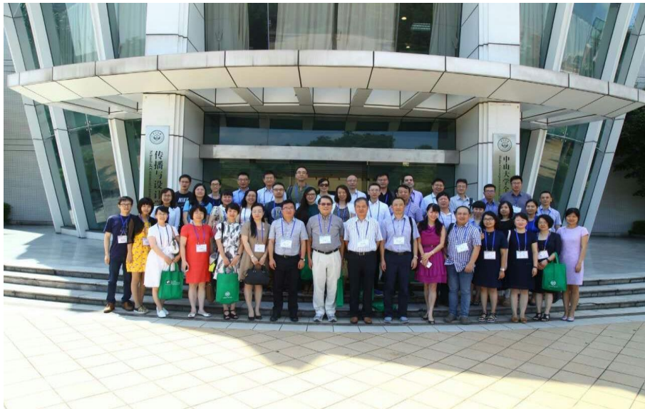
2016年7月29日 第九届“中华青年传播学者论坛”在中山大学传播与设计学院召开