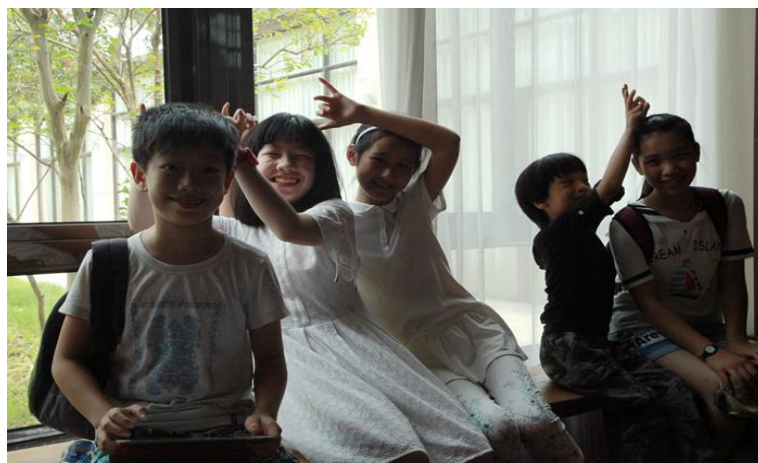
台风来了，温泉关了，在康桥酒店里纵情玩耍的天真可爱的“多二代”们