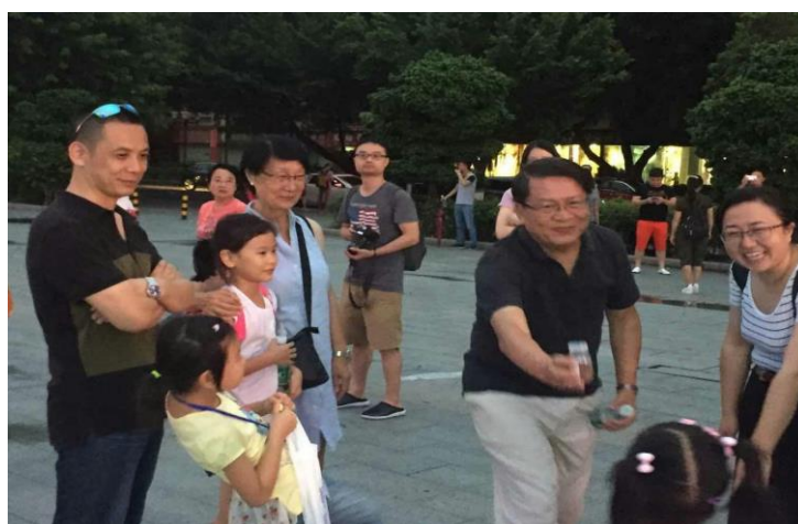
爱学生就像爱自己孩子、爱多二代就像爱自己小孙女的老师和师母