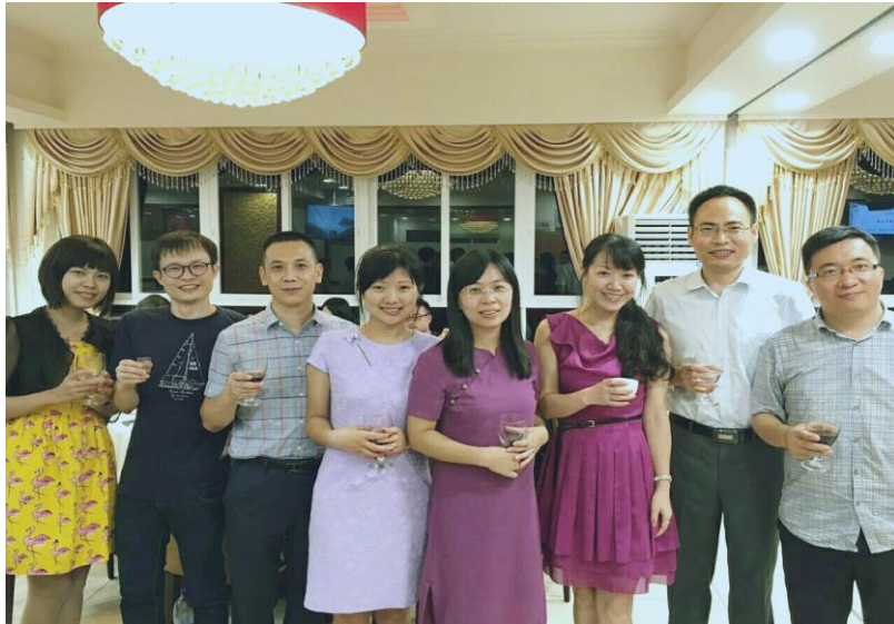
中大好同事，为你们点赞！