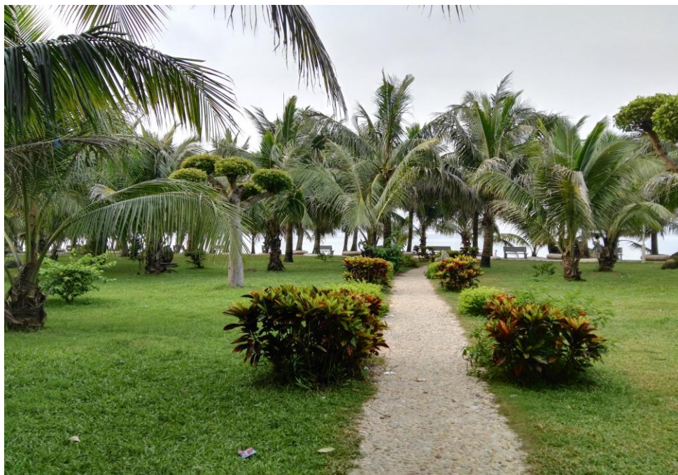
不顾一切跋涉千里