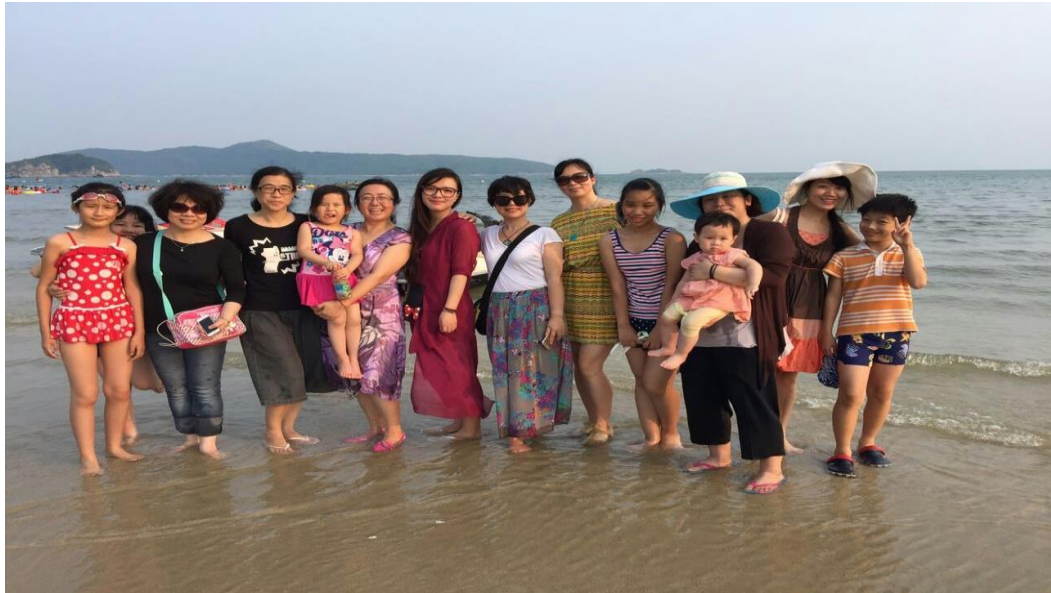
“各美其美，美人之美，美美与共” @下川岛

么事，可以相互帮助、相互支持。多友的“友”其实是一个动词，并不是说在一个共同体里大家天然地一定会成为朋友，而是大家可以用“友直、友谅、友多闻”的态度去交友，诚心诚意。