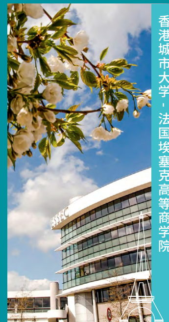
香港城市大学 · 法国埃塞克高等商学院