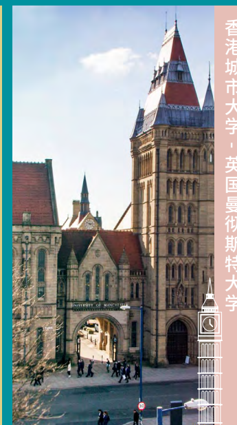
香港城市大学 · 英国曼彻斯特大学

如欲获取更多资料, 请浏览网址 cityu.edu.hk/admo/joint-bachelors-degree-programmes-overseas-universities