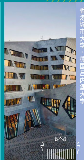
香港城市大学 · 德国吕内堡大学