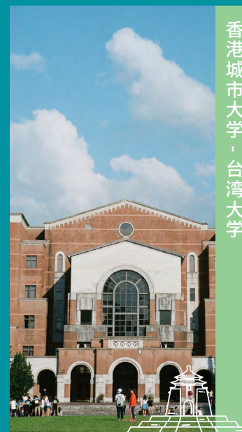
香港城市大学 · 台湾大学