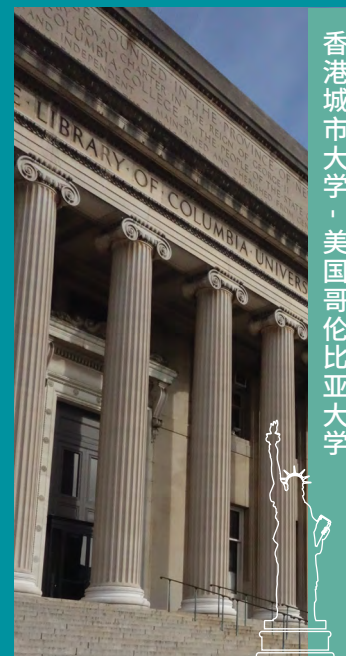
香港城市大学 · 美国哥伦比亚大学

城大与国际知名大学合办多项双联学士学位课程。为本科生提供国际化的学习机会。学生于四年间在两所大学学习同一专业规定的学士课程后，毕业时将分别获得两所大学所颁发的学士学位。