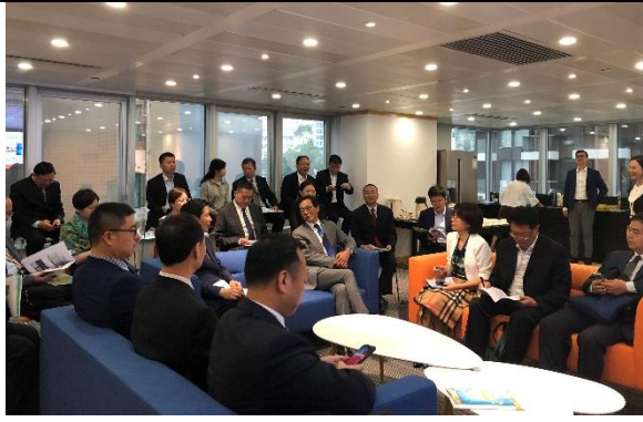
與個人資料私隱專員黃繼兒先生交流