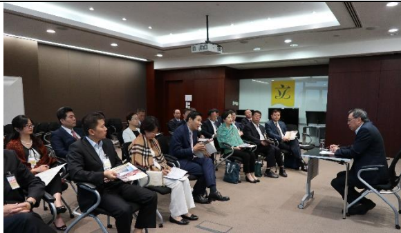
與立法會主席梁君彥先生交流