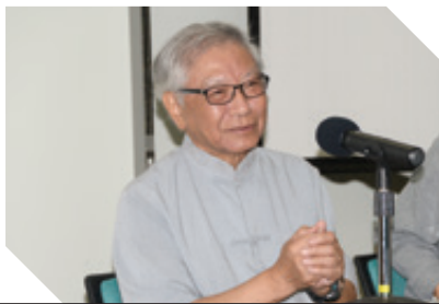
Speakers shared with Foundation members at Cultural Salon. 嘉賓與基金成員在文化沙龍活動中分享。