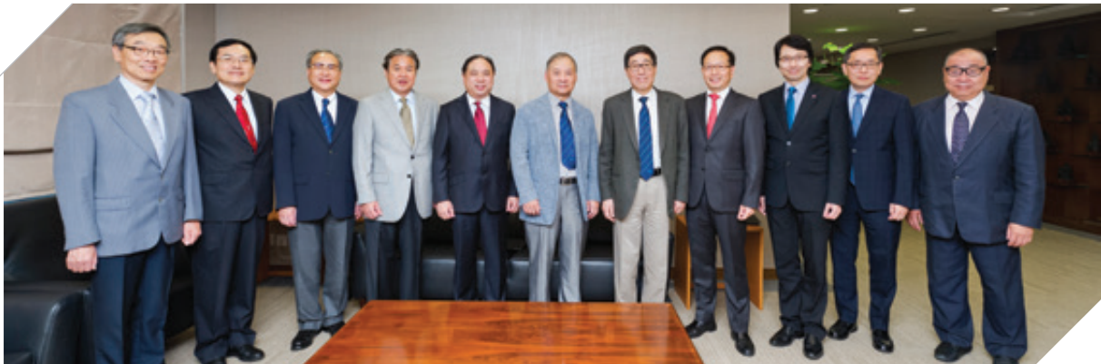
Members of CityU Foundation's Board of Governors 城大基金理事會成員

The Board of Governors is responsible for providing advice on the development strategies of the Foundation and soliciting funds to support the University. The Board has one sub-committee, the Alumni Advancement Committee, which supports the University to raise funds from alumni and their networks.