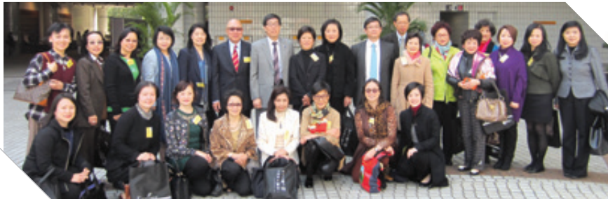
Representatives from Ladies' Committee of The Chinese General Chamber of Commerce (CGCC) visited CityU. 香港中華總商會婦女委員會代表到訪城大。