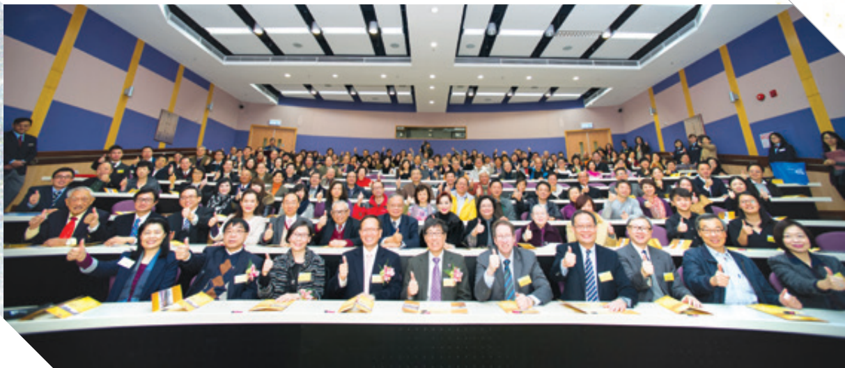
Guests attending the ceremony fill the lecture theatre. 眾多嘉賓出席命名典禮。