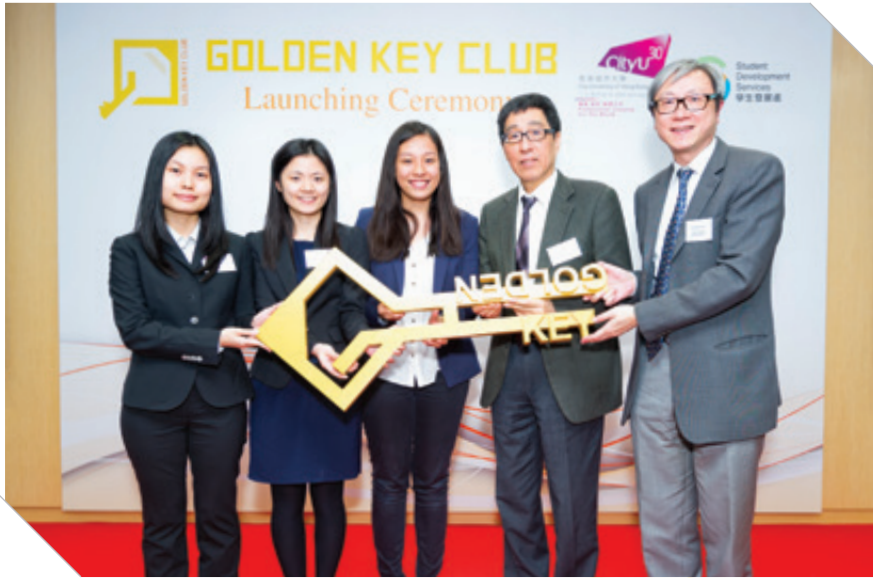
The golden key symbolises turning on the potential of students. 金鑰匙模型寓意開啟學生的潛能。